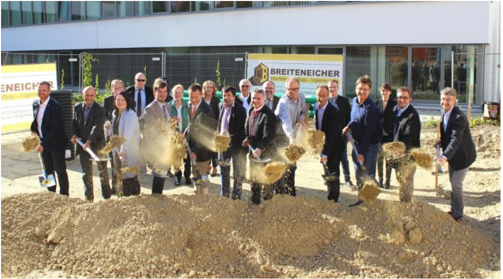
Spatenstich zur Erweiterung des Kreiskrankenhauses Vilsbiburg durch einen Funktionstrakt mit Operationsbereich, Intensivstation und Zentralsterilisation