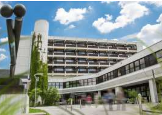
Krankenhaus Landshut-Achdorf

Bisher wurde dieser Eingriff lediglich in großen Kliniken wie dem Deutschen Herzzentrum oder der Uniklinik München durchgeführt. Aufgrund der modernen technischen Ausstattung sowie der herausragenden Kompetenz von Dr. Pyxaras bei katheterbasierten Therapieverfahren kommt diese Therapie nun auch am Krankenhaus Landshut-Achdorf zum Einsatz. Weitere Informationen unter www.LAKUMED.de .